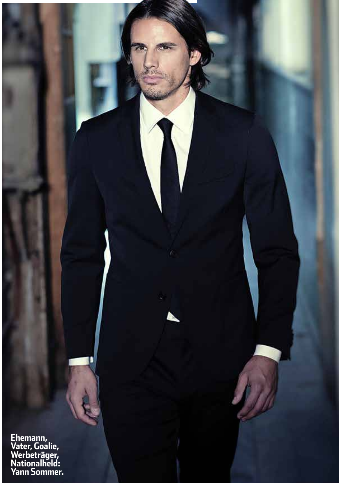
Ehemann, Vater, Goalie, Werbeträger, Nationalheld: Yann Sommer.

Hat Ihre Tochter kapiert, dass Papi in der Schweiz ein Held ist?