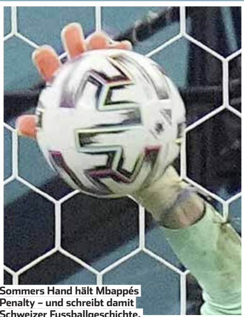
Sommers Hand hält Mbappés Penalty – und schreibt damit Schweizer Fussballgeschichte.