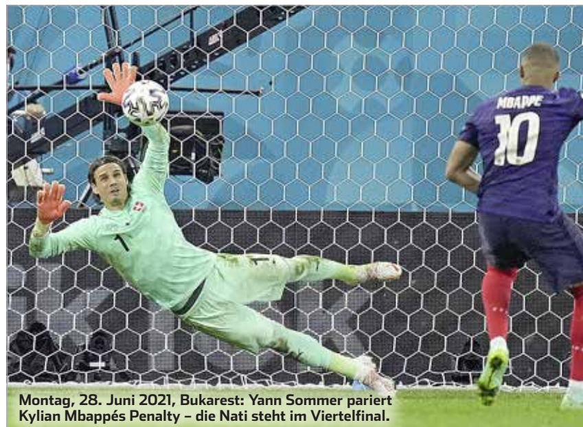
Montag, 28. Juni 2021, Bukarest: Yann Sommer pariert Kylian Mbappés Penalty – die Nati steht im Viertelfinal.

Wir sind zusammengesessen und haben abgeglichen, was wir voneinander erwarten. Haben uns mit und ohne Trainer in der Gruppe unterhalten. Dieses Teamtreffen war wichtig. Wir redeten über Körpersprache, Leistung, alles, was nicht gestimmt hat. Dann haben wir über unsere Ziele gesprochen. Und gingen Vollgas in Richtung Türkei-Spiel.