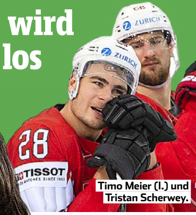
Timo Meier (l.) und Tristan Scherwey.